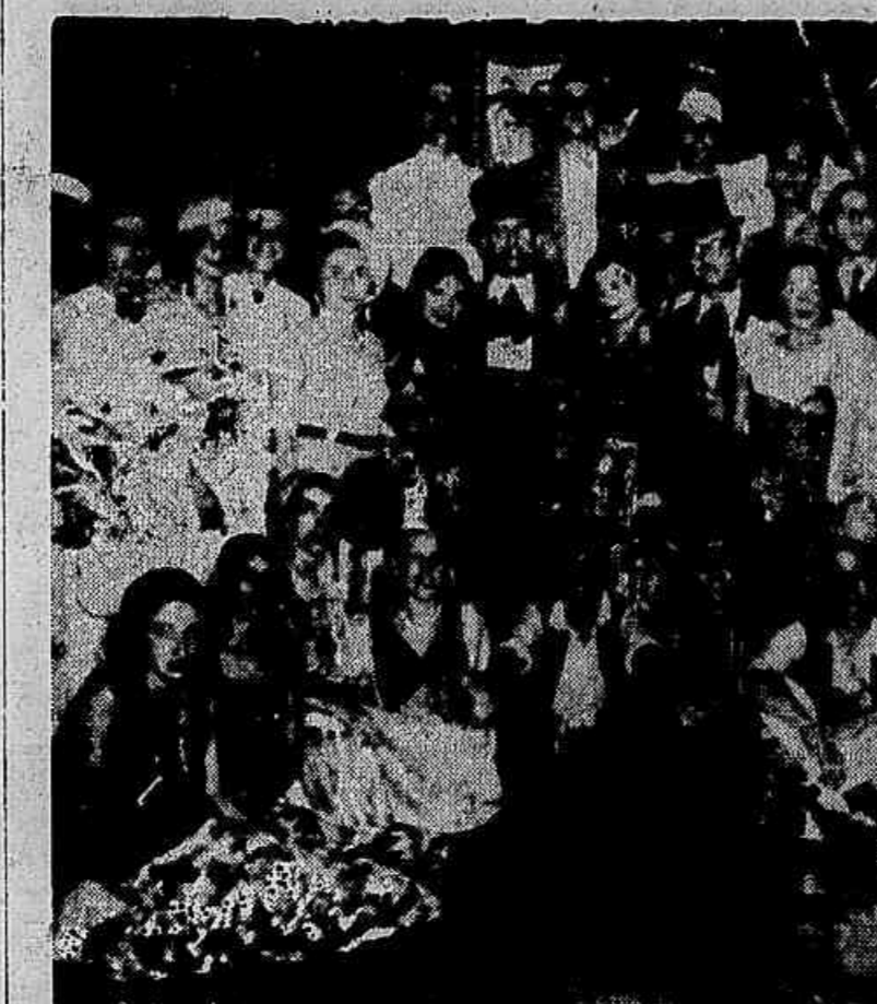
Um lindo grupo tirado nos salões do Dopelavore, no baile de 'Ante-homen'.

O baile de segunda-feira gorda, no Theatro Municipal, constituiu, sem nenhuma duvida, a nota dominante dos festejos carnavalescos de 1933. Tudo contribuiu para que a festa atingisse os requintes de elegancia, bom gosto e animação que a assignalaram desde o primeiro momento. A